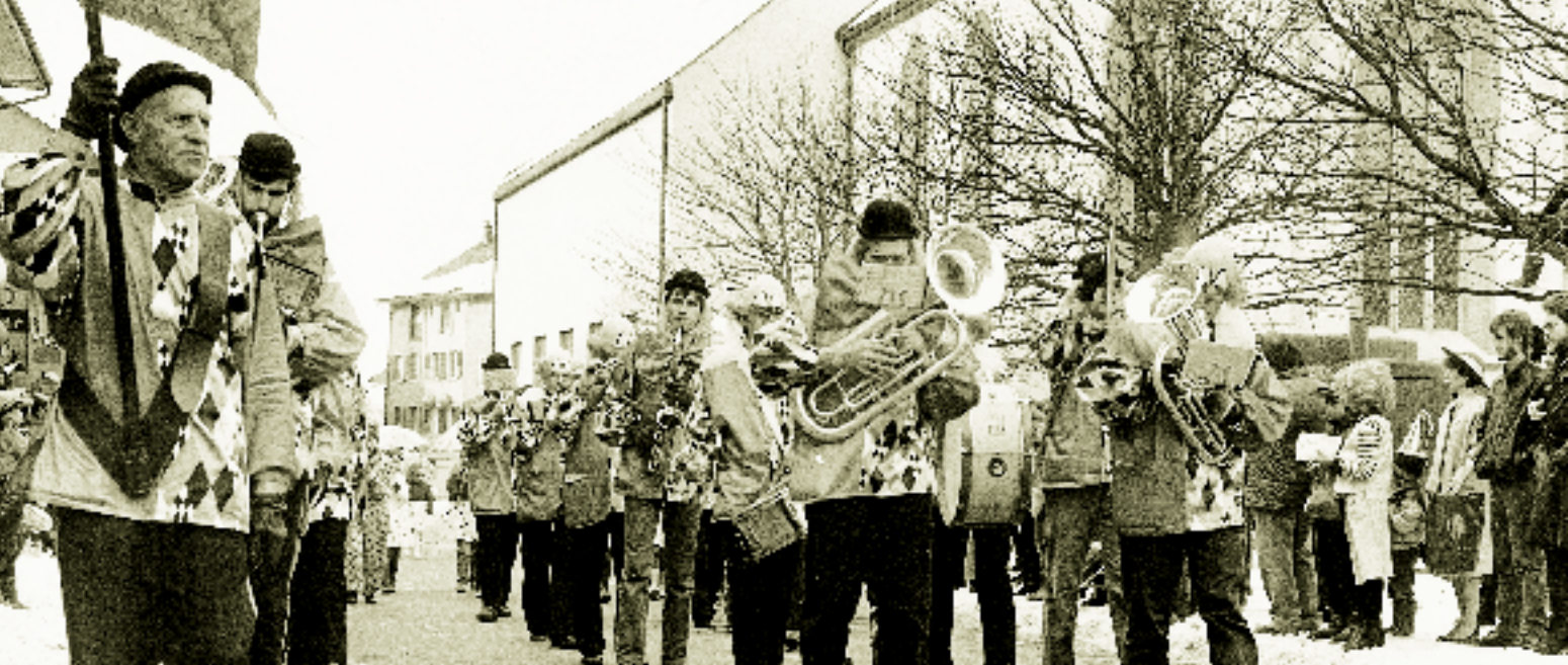
1985; Die Stadtmusik führt den Fasnachtsumzug an.

Stadtmusik führten die Umzüge an. Die Fasnachtsstorzen lösten die Fasnachtsgesellschaft ab. Sie organisierten das Fasnachtstreiben im Städtchen bis 2000. Als sich die Fasnachtsstorzen auflösten, sorgte die Stadtmusik wieder dafür, dass die Räbenhegel am Schmutzigen Donnerstag die Fasnacht eröffneten und am Dienstag nebst der Tagwache, Gottesdienst und Weggliverteilen am Nachmittag ein Kinderumzug stattfanden. Neuerdings kümmert sich die Frauengruppe «Städtlikonfetti» um den Klingnauer Umzug.