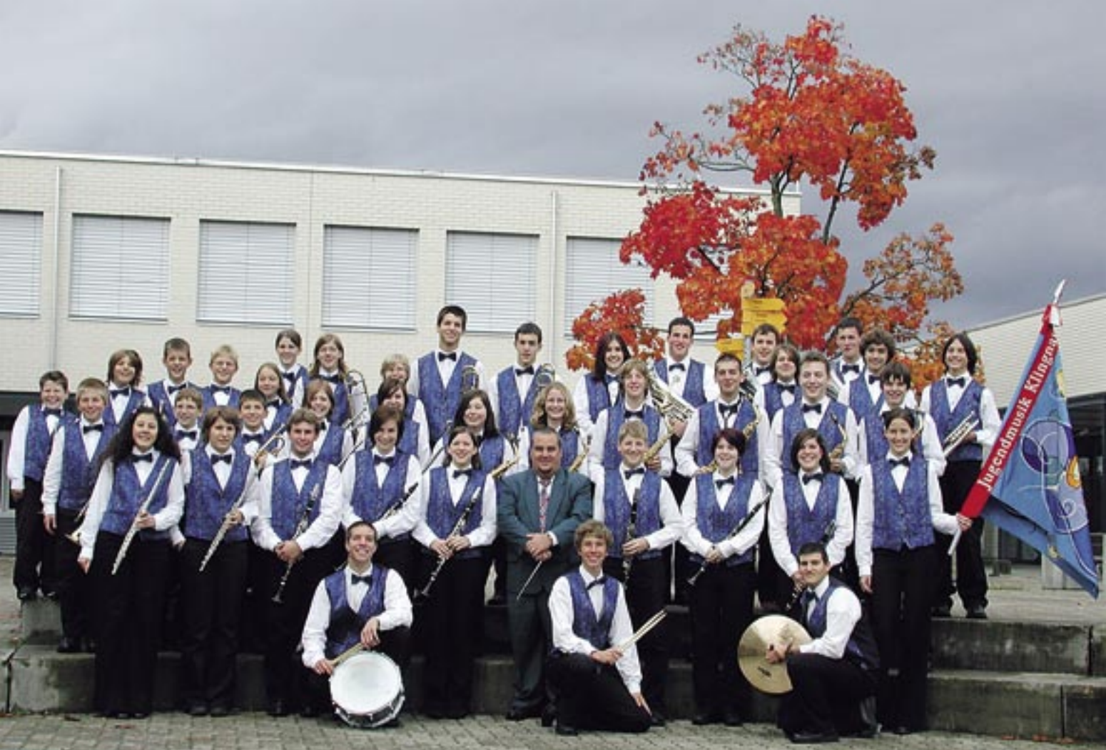
Die Jugendmusik Klingnau im Jahre 2004.