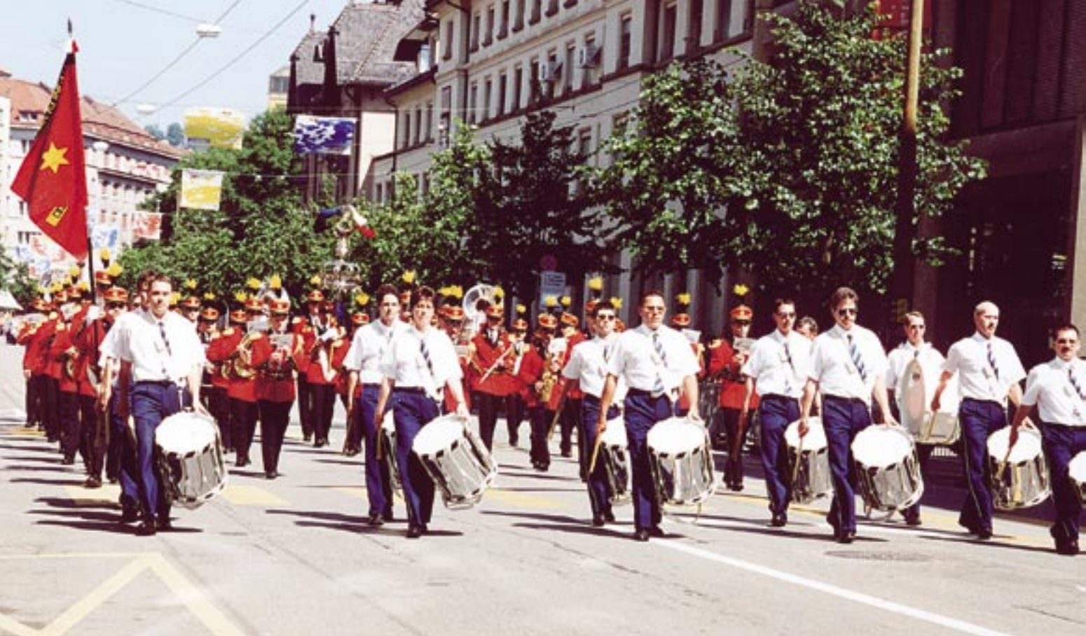
2001; Eidg. Musikfest Fribourg.