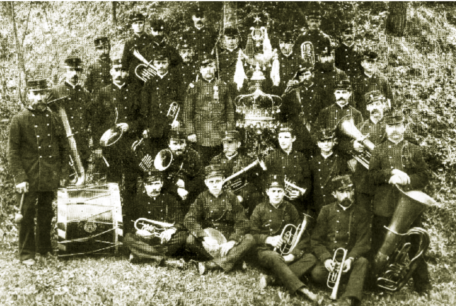
Stadtmusik Klingnau anno 1891.