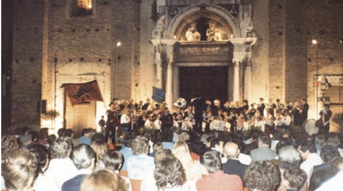
1982; Platzkonzert auf der Piazza Duomo in Salo.

Das zweite Kirchenkonzert lockt weniger Zuhörer an als das erste, vermutlich weil es am Samstagabend stattgefunden hat.