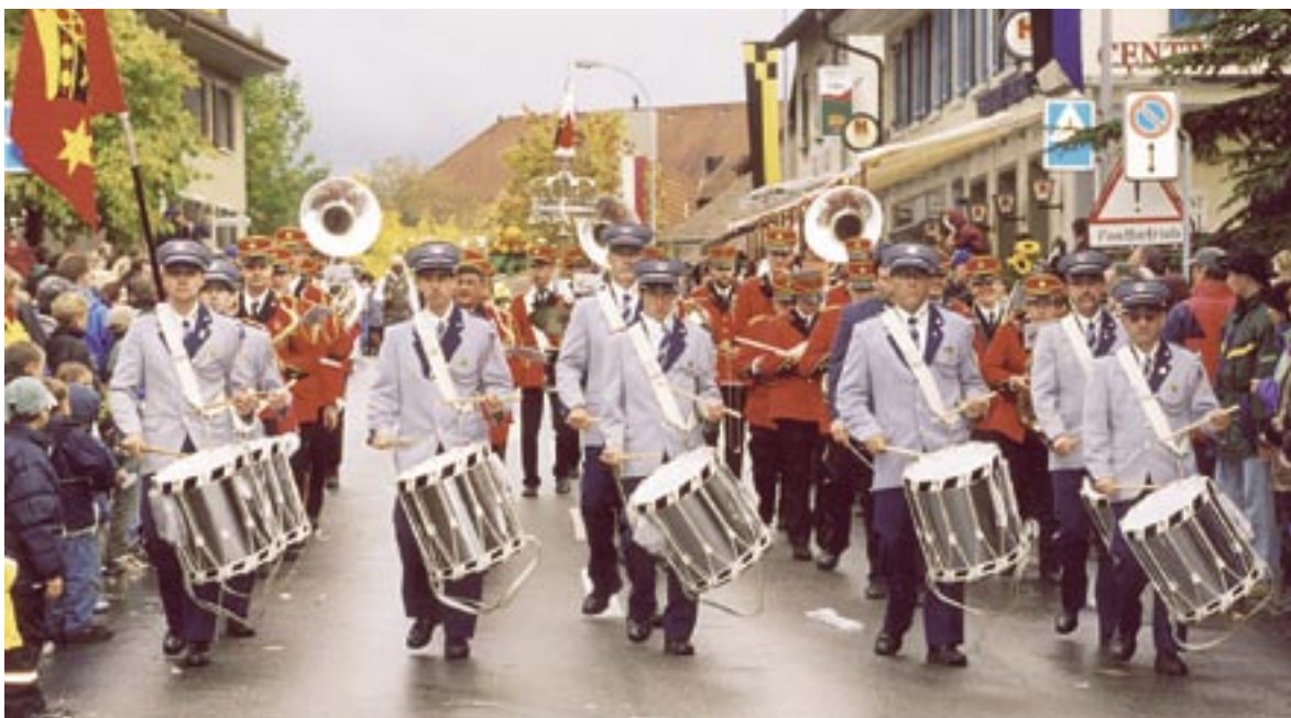
2002; Am Döttinger Winzerfest.

gibt die Stadtmusik am Sonntag vor dem Mittag ein «fätziges» Platzkonzert vor grossem Publikum. Am Abend ziehen die Klingnauer Musikantinnen und Musikanten zufrieden mit dem «Flieger» im heimischen Städtchen ein. Die erreichten Punktzahlen für ihre Vorträge dürfen sich sehen lassen. Das Jahreskonzert ist gleichzeitig das Abschieds-