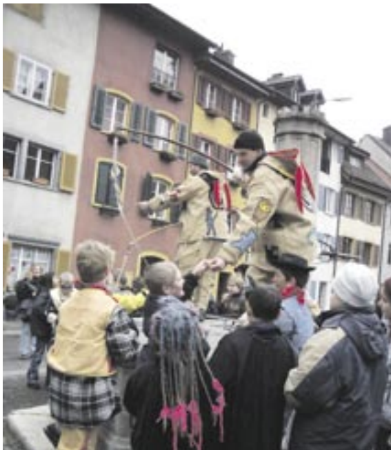
Die Kinder erhaschen sich von den beiden Räbehegeln einen Wurstzipfel.