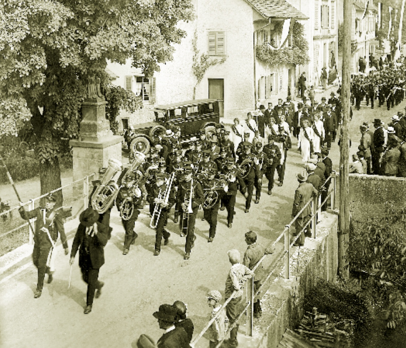
1932; Einmarsch der Musikvereine am Kantonalen Musiktag durch die festlich geschmückte Weierstrasse.