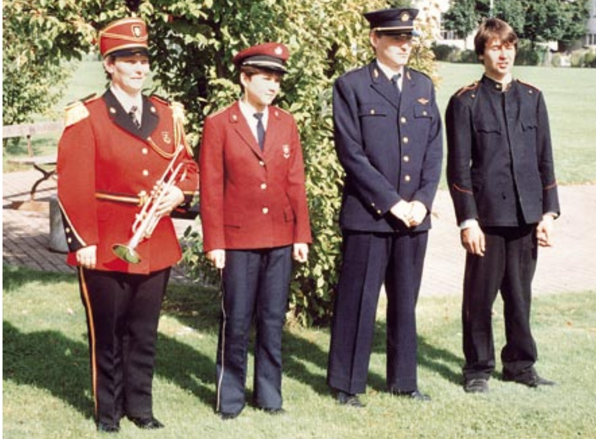
1987; Die Uniform der Stadtmusik, von rechts, 1925, 1949, 1970, 1987.

trages der Statuten wird tags darauf um ein Jahr verschoben.